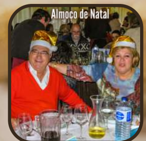
Almoço de Natal