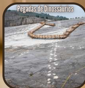
Pegadas de Dinossáurios