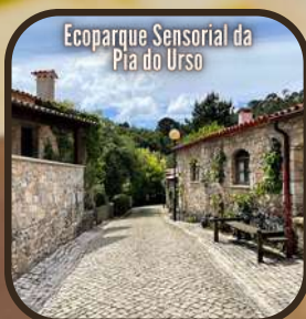
Ecoparque Sensorial da Pia do Urso